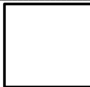
HUELLA INDICE DERECHO

NOMBRE: _____ C.C No. _____ TEL-WHATSAPP: _____ EMAIL: _____ DIRECCIÓN: _____